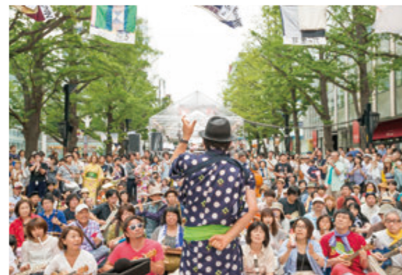
「札幌国際芸術祭2014での実施風景」